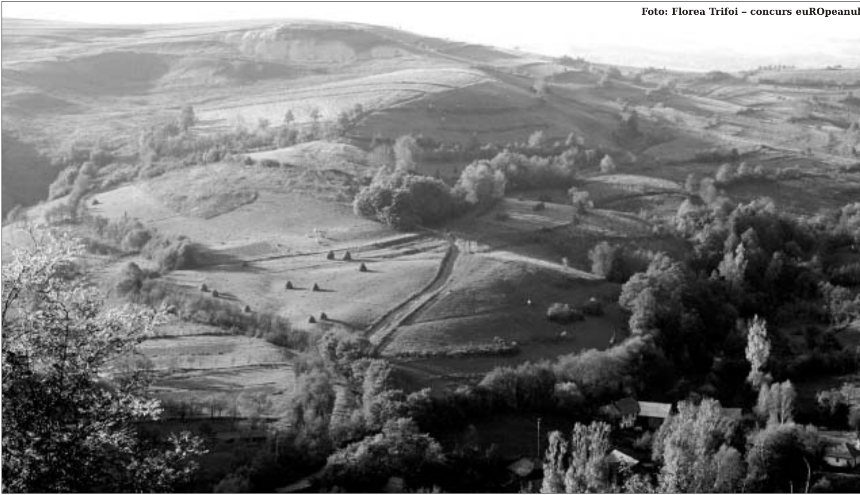
concurs euROpeanul